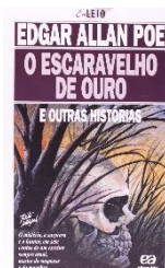
O Escaravelho de ouro Edgar Allan Poe

OBSERVAÇÕES: identificar todos os materiais com o nome do aluno; colocar o nome do aluno nas capas dos livros, dos cadernos e das pastas; poderão ser solicitados materiais complementares durante o ano letivo, dependendo dos projetos; os materiais que compõem esta lista são indispensáveis no dia-a-dia escolar; repor o material ao longo do ano letivo, sempre que houver. Também é necessário manter o material do ano de 2022 da matéria de espanhol para consulta e aprendizado extra.